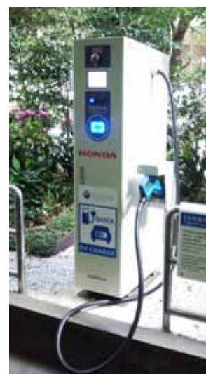
300 基目の急速充電器